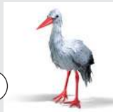
la Cigone blanche