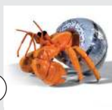
le Bernard l'ermite