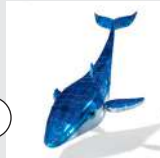
la Baleine bleue