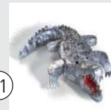
le Crocodile du Nil