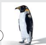
le Manchot empereur